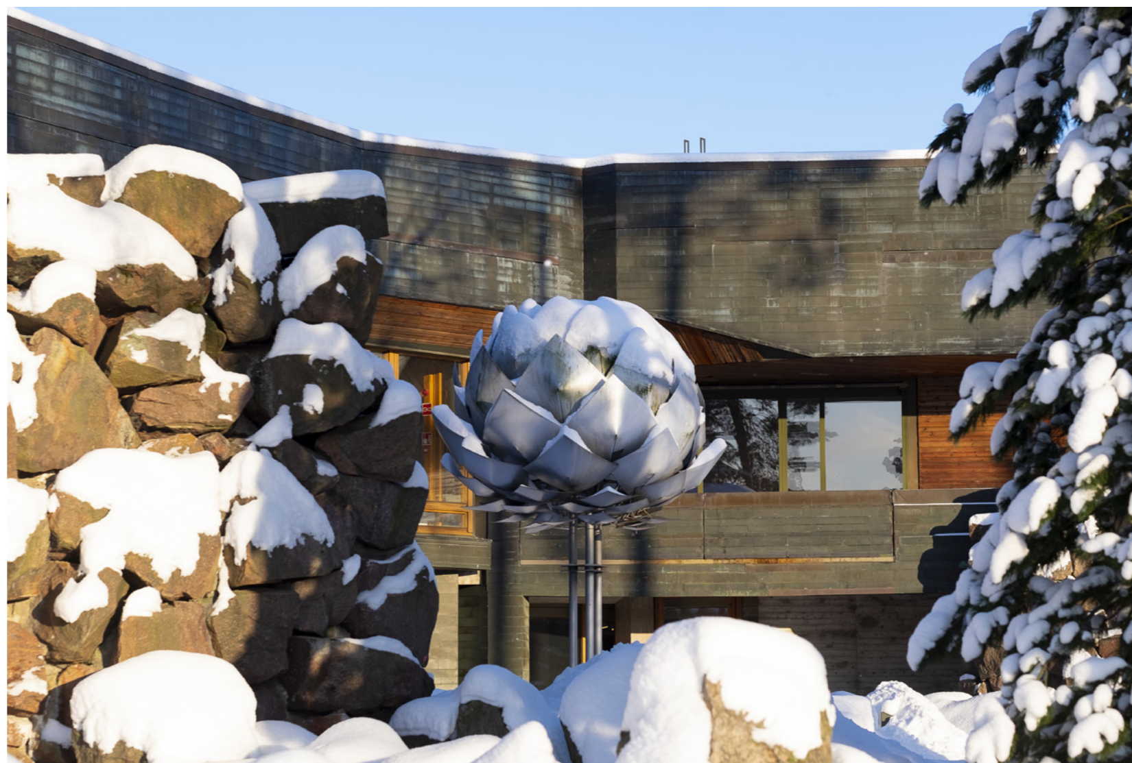
Aalto-korkeakouluääitiö sr toimii Aalto-yliopistona. Säätiöyliopiston toimintaa säätelevät yliopistolaki (558/2009), säätiölaki (487/2015) ja säätiön säännöt.

Yliopisto noudattaa kaikessa toiminnassaan kansainvälisesti korkeatasoisen yliopistotoiminnan eettisiä periaatteita ja hyvää hallintotapaa sekä turvaa sisäisessä hallinnossaan opetuksen, tutkimuksen ja taiteen vapauden edellyttämän akateemisen itsehallinnon ja siihen olennaisesti kuuluvan professorikunnan riippumattomuuden.