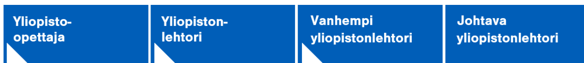
Kuva 1. Lehtorien urajärjestelmän tasot.

Aalto-yliopiston lehtorien urajärjestelmässä on neljä tasoa: yliopisto-opettaja, yliopistonlehtori, vanhempi yliopistonlehtori ja johtava yliopistonlehtori (ks. Kuva 1).